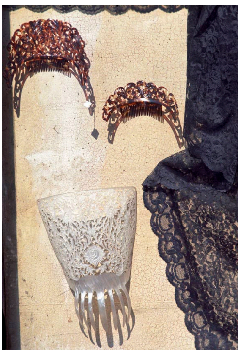
Pintes i mantellina d'una botiga de la Rambla. 1969.

També dels anys quaranta, hi ha una fotografia del carrer de Petritxol, on hi ha la galeria d'art Sala Parés, en la qual Picasso va exposar per primera vegada el 1901. A la imatge, s'hi poden veure unes ulleres de pinça de mida gegantina que servien de reclam publicitari d'una òptica i que ens fan pensar directament en el pinçanàs de Jaume Sabartés, secretari de Picasso. Aquest fet esdevé una coincidència visual sorprenent que ens obliga a preguntar-nos si Gomis en devia ser del tot conscient.